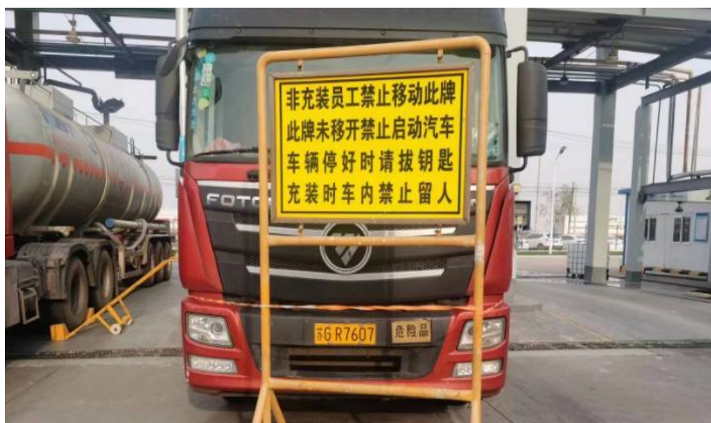
图2：挡车器摆放位置

间（见图3），罐车顶部进料口已经打开，鹤管已经插入进料口，液压伸缩悬梯未完全伸展接触罐车罐体（见图4），向后上方回弹，距离罐车罐体约0.5m，液压伸缩悬梯正下方偏东有一摊直径约25cm血迹（见图5）。