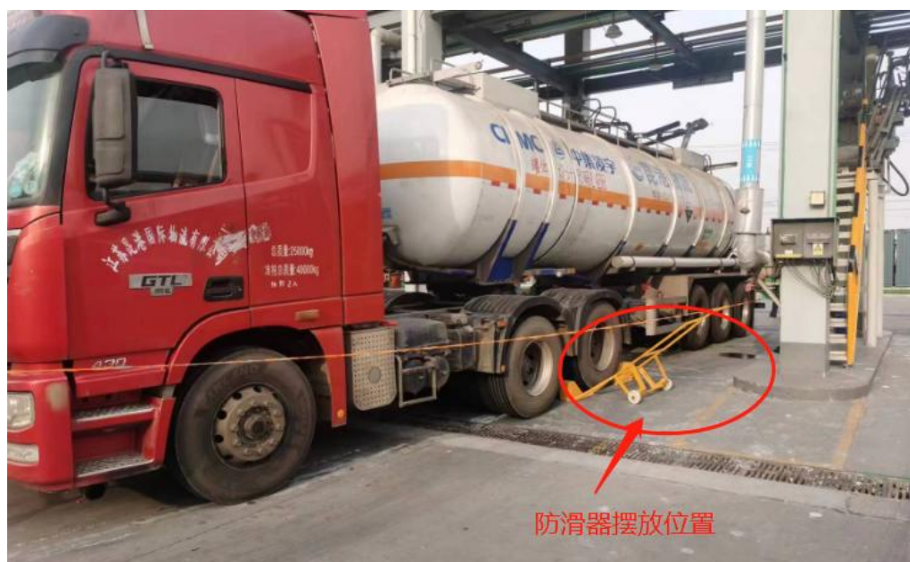
图3：防滑器安放位置